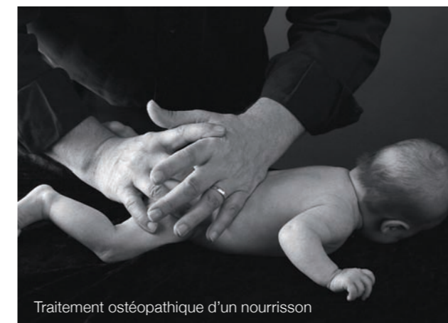
Traitement ostéopathique d'un nourrisson