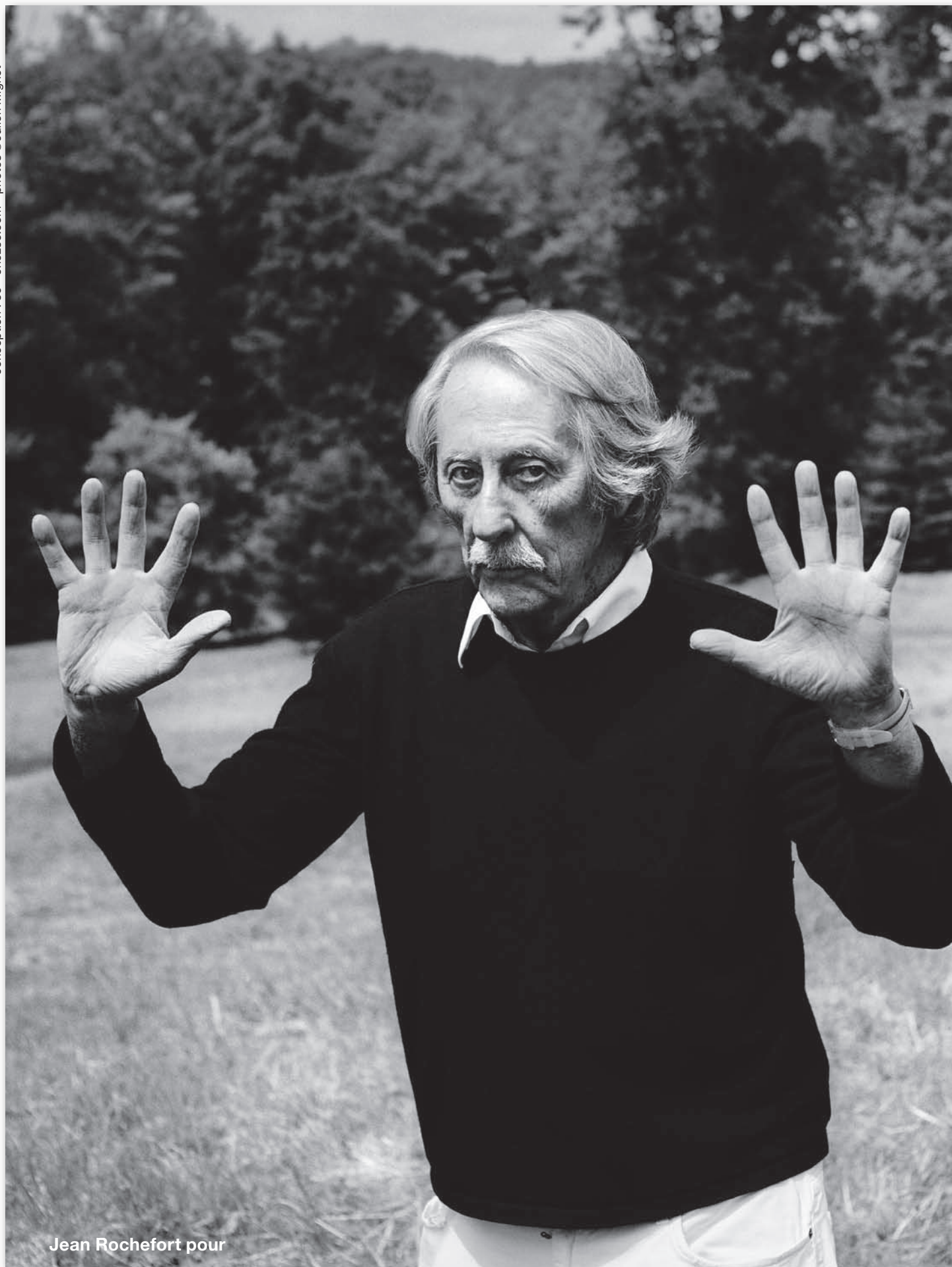
Jean Rochefort pour