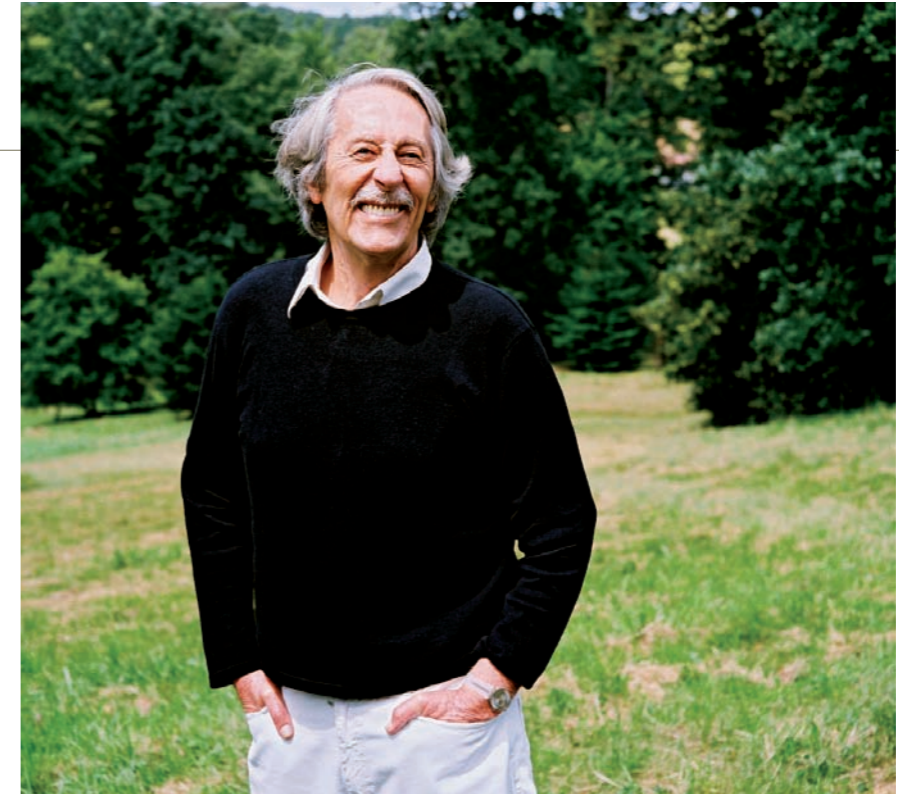
Jean Rochefort :