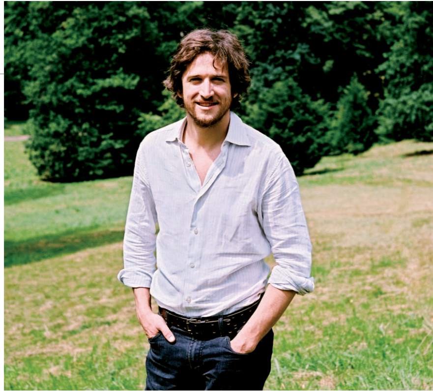
Guillaume Canet :

« J'ai besoin de voir mon ostéo une fois par mois ! »