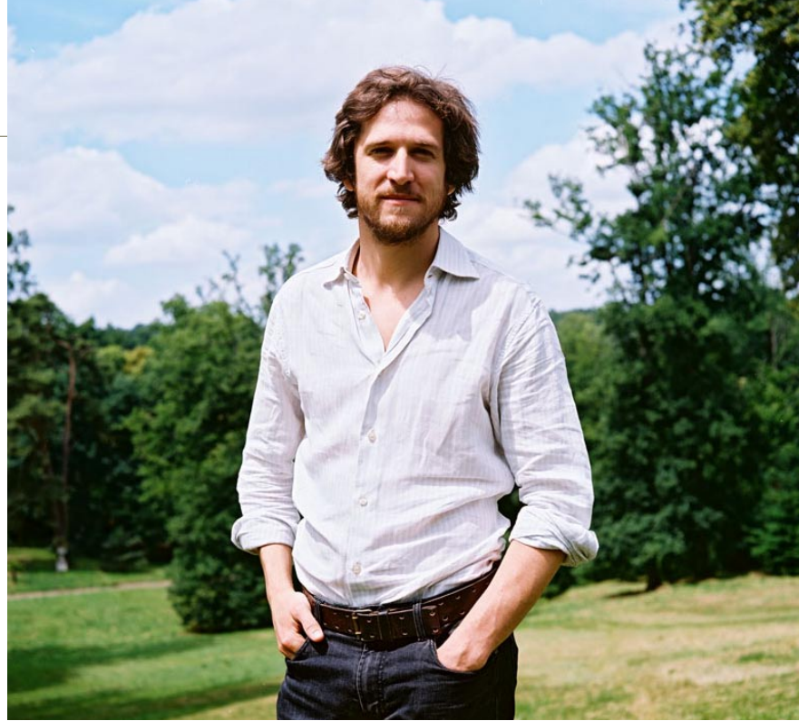
Guillaume Canet :

« J'ai besoin de voir mon ostéo une fois par mois ! »