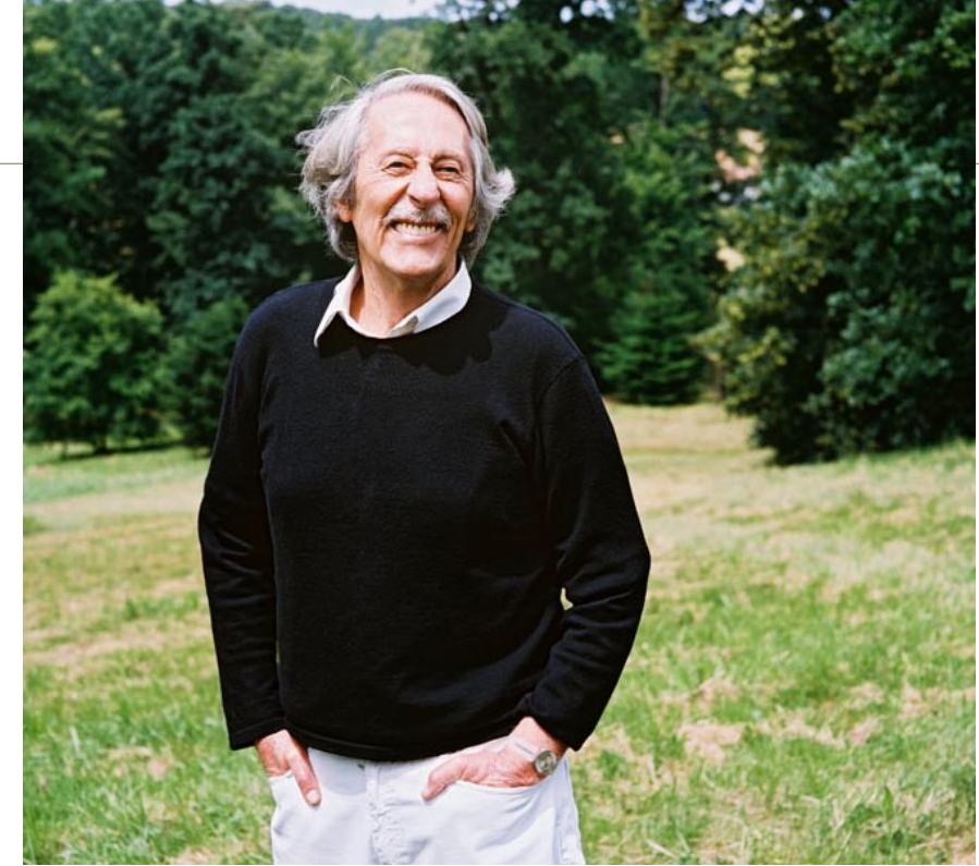
Jean Rochefort :