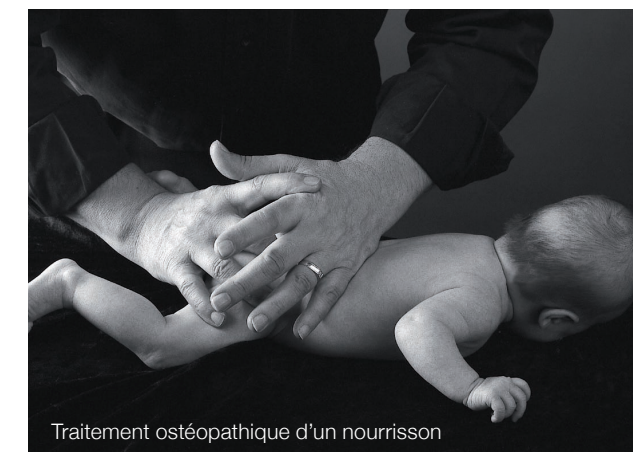
Traitement ostéopathique d'un nourrisson