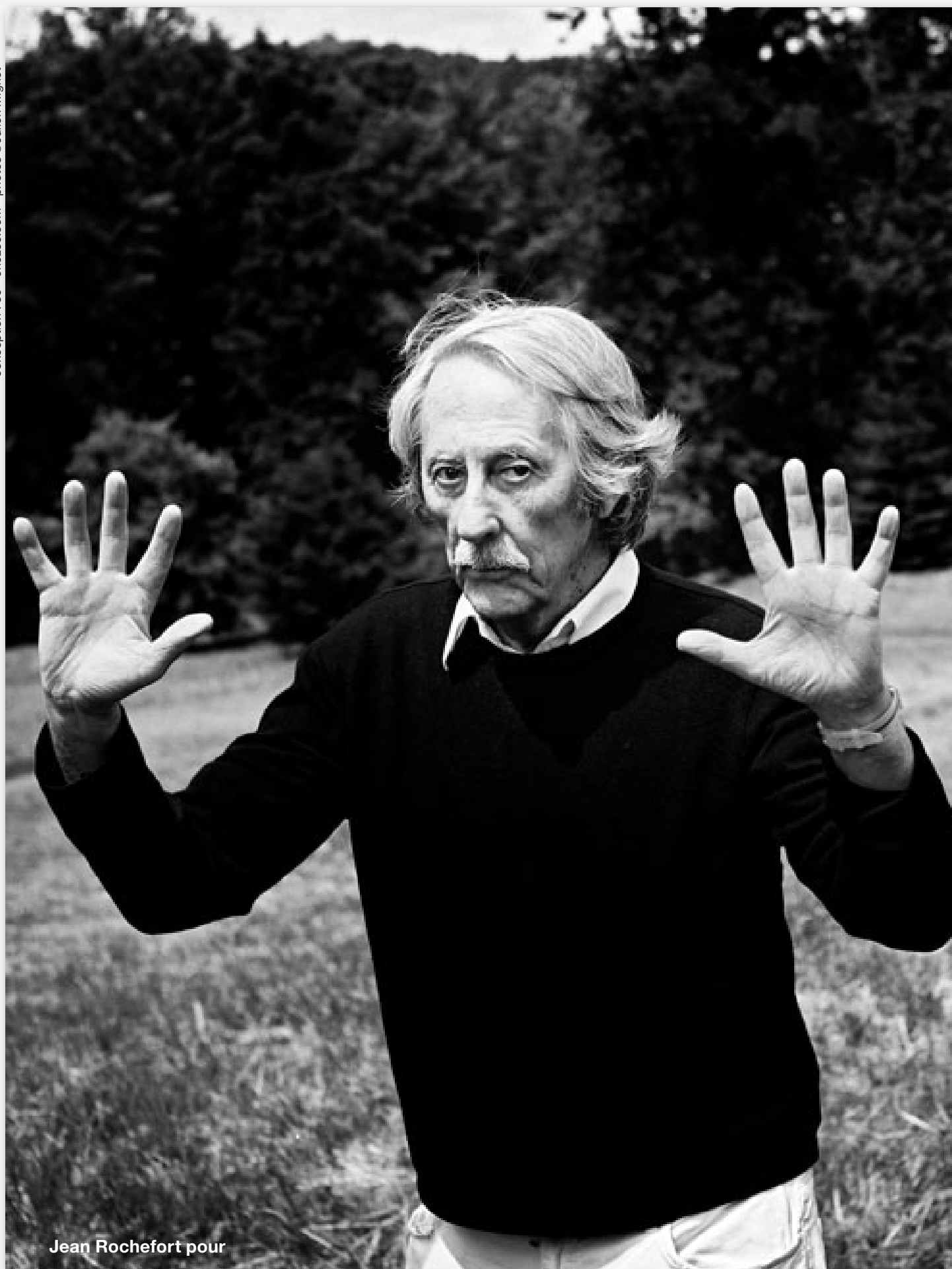
Jean Rochefort pour